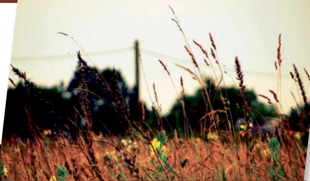
Malownicze łąki w Kozłach