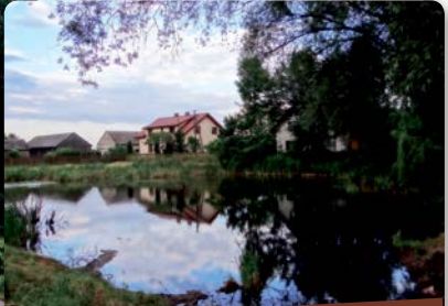
Jeden z wielu stawów, które możemy podziwiać przejeżdżając trasę