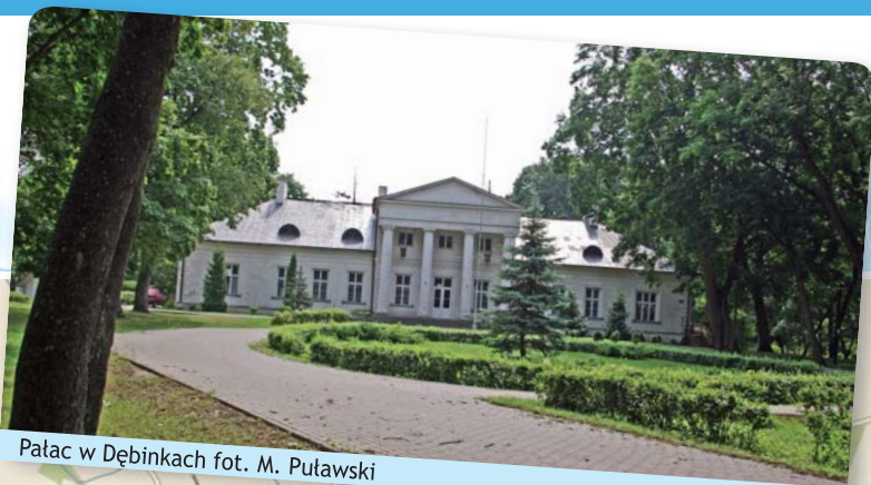
Pałac w Dębinkach