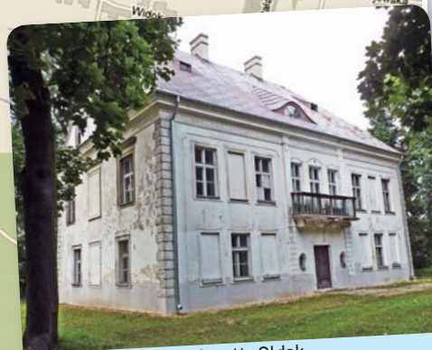
Pałac w Chrzęsnem