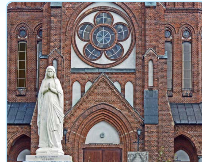
Kościół w Postoliskach